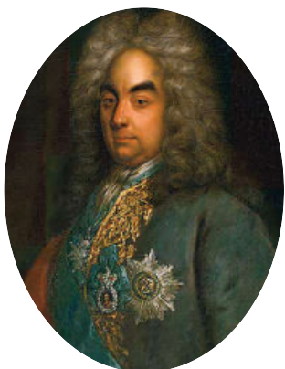
Петр Андреевич Толстой