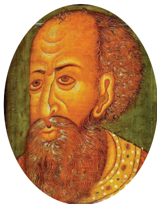
Царь Иван IV Грозный