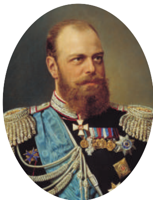
Император Александр III