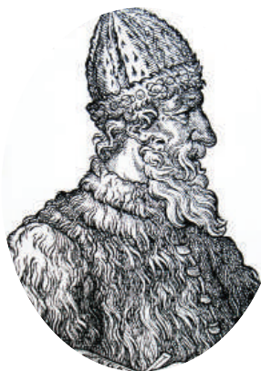
Великий князь Иван III

До XVIII века чиновники на Руси жили благодаря так называемым «кормлениям», то есть, при отсутствии оклада за исправление должности, разрешению на подношения от заинтересованных в их деятельности лиц. Одаривали их не только деньгами, но и «натурой» — мясом, рыбой, пирогами и пр., что было делом обыкновенным.