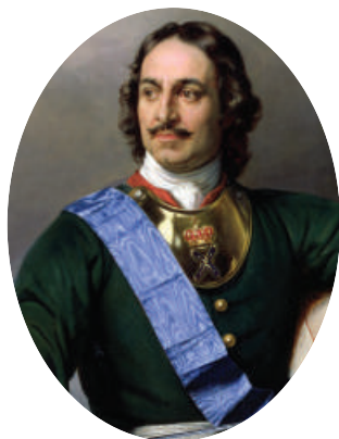
Император Петр I

Сообщениями «о похищении казны» первоначально занималась тайная канцелярия во главе с графом П.А. Толстым. И работала она на совесть. Но были и такие дворяне и чиновники, которые к проблеме мздоимства относились гораздо терпимее. По рассказам современников, однажды в Сенате Петр пригрозил издать указ, по которому всякий, кто украдет у казны сумму, на которую можно купить веревку, будет повешен. Генерал-прокурор Ягужинский на это заметил: «Неужели вы хотите остаться императором без служителей и подданных? Мы все воруют — с тем только различием, что один больше и приметнее, чем другой».