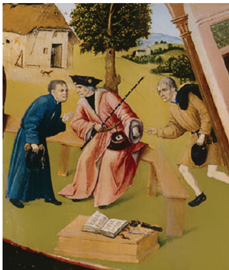
Фрагмент «Алчность» картины Иеронима Босха «Семь смертных грехов»

Рассматривая участников коррупции на примере взяточничества, стоит отметить, что в коррупционном процессе всегда участвуют две стороны. Одна сторона — это взяткополучатель (подкупаемый). Вторая сторона — это взяткодатель (осуществляющий подкуп). Также в процессе может участвовать и третья сторона — посредник.