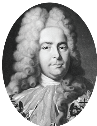
Генерал-прокурор Павел Иванович Ягужинский